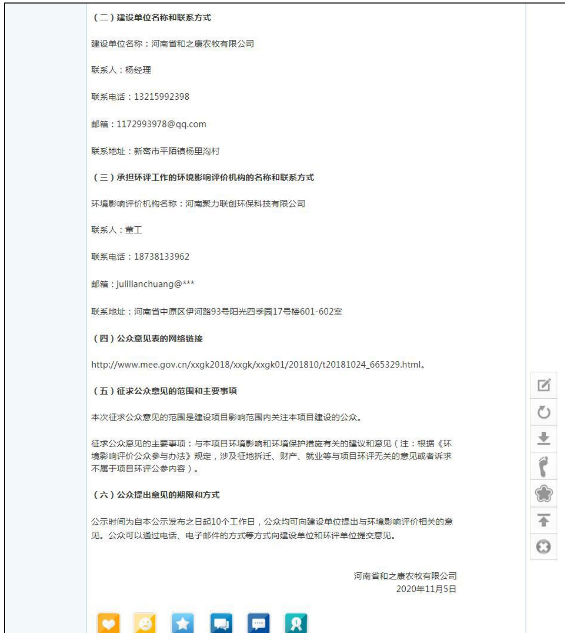
图 1 第一次公示截图