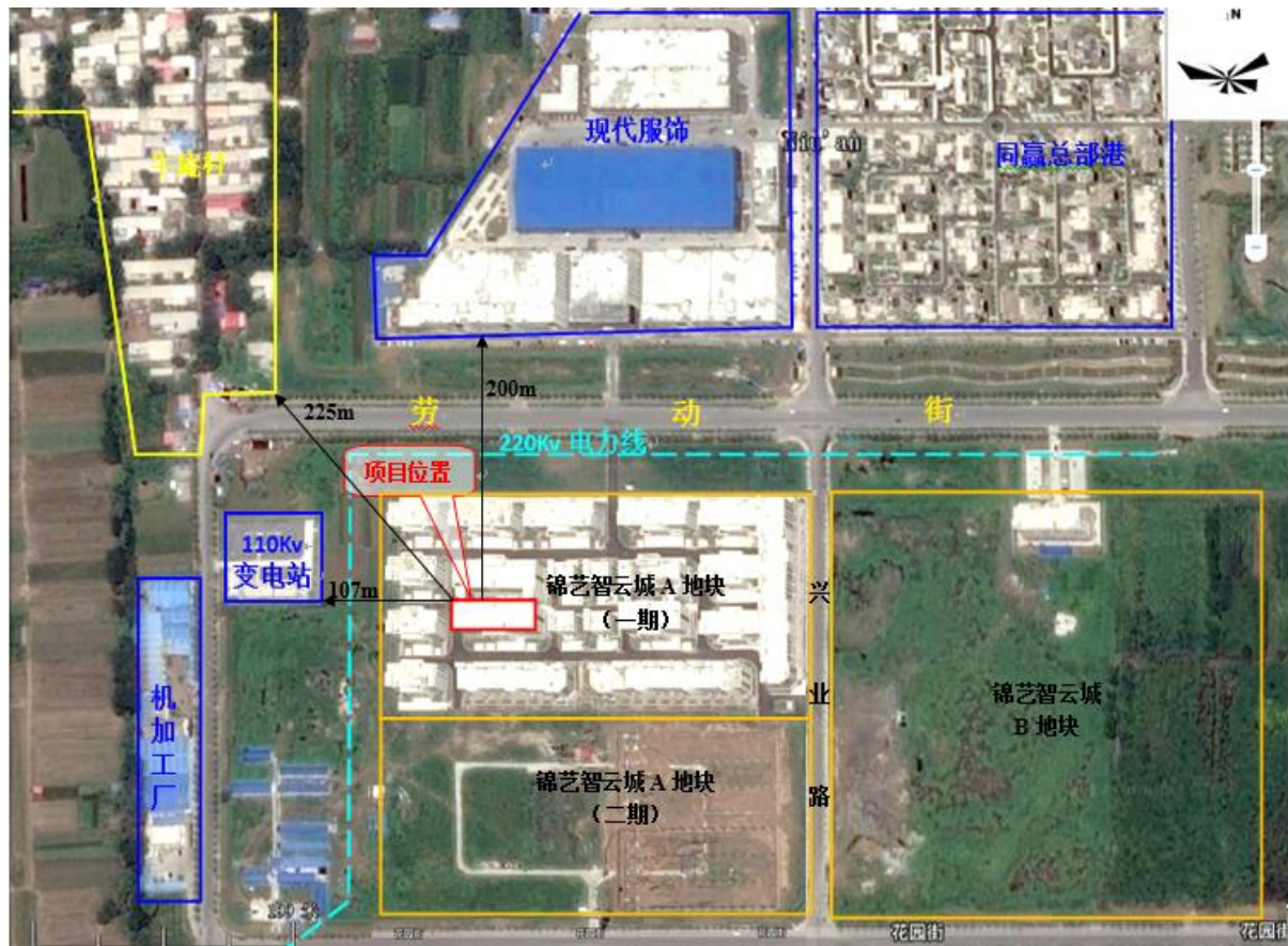
图 1 项目周围环境概况图