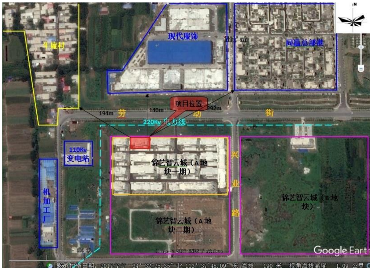
图 1 项目周围环境概况图

距离本项目较近的环境敏感点主要为西北侧约 194m 的牛庵村。项目周围环境概况见图 1 和附图二。