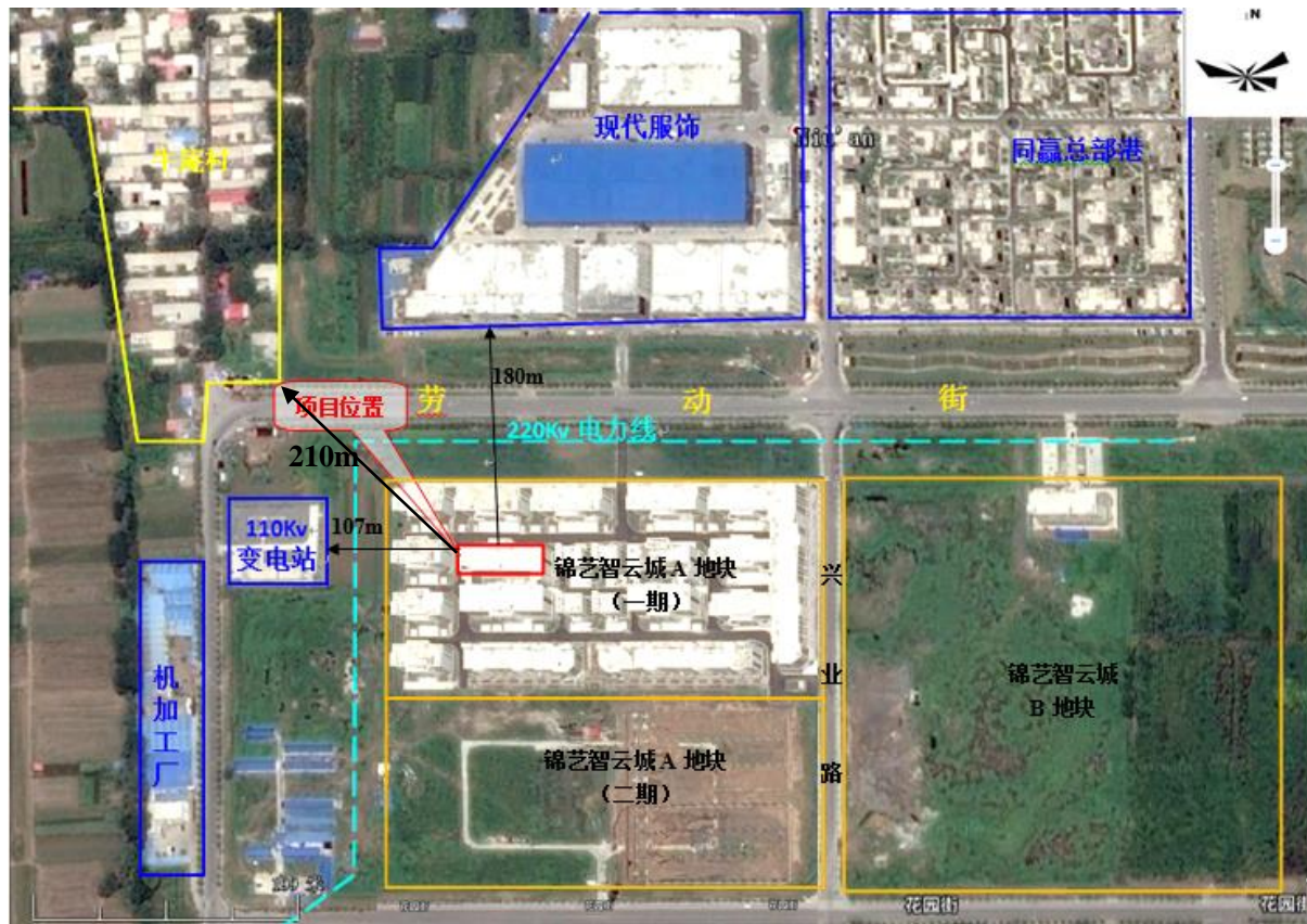
图 1 项目周围环境概况图