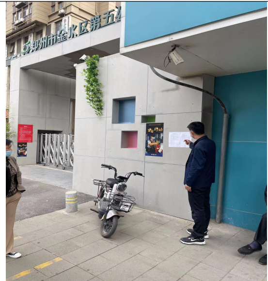
金水区第五幼儿园