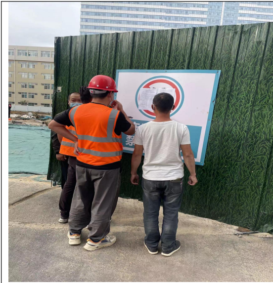
河南省肿瘤医院内本项目选址处

河南省肿瘤医院在周边较为敏感的地点（医院内部、肿瘤医院家属院、金水区第五幼儿园、聂庄西苑）张贴第二次公示，以征求公众对本项目在环境保护等方面的意见和建议，现场张贴见下图。