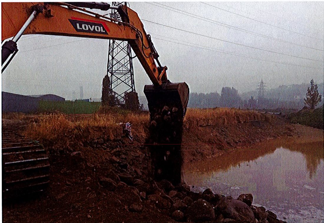
整改现场，填平大坑、清理物料并进行复耕。