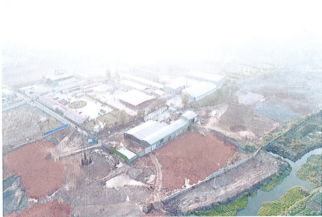
整改后航拍图，物料清理、大坑填平并复耕到位。