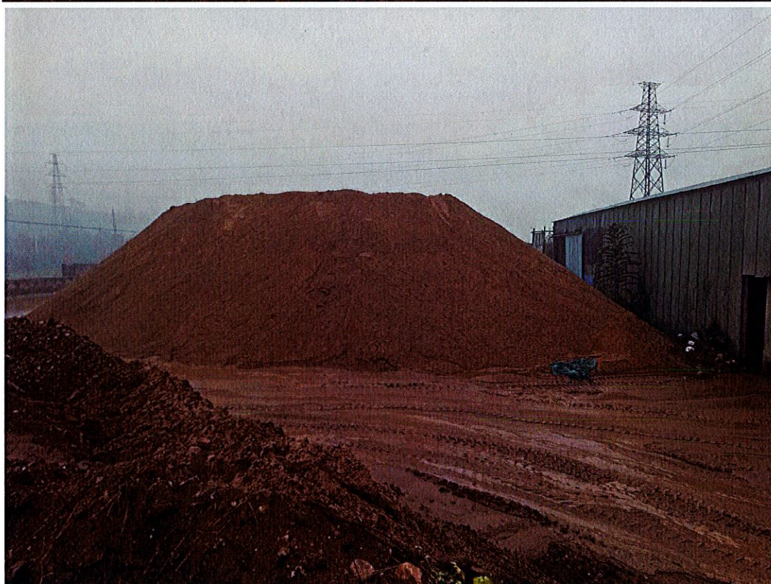
实地查看现状地貌坑洼不平、物料堆积。