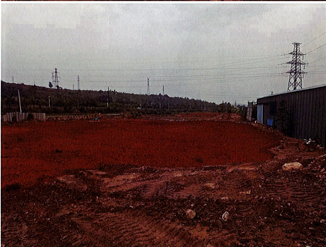
物料清理、大坑填平并复耕后。